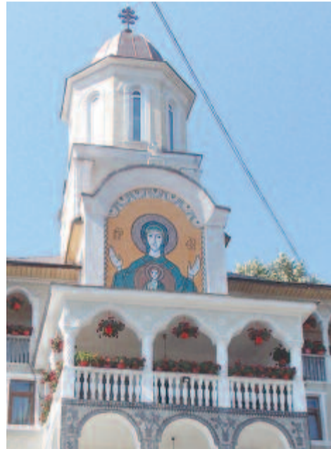
A Szent Anna ortodox kolostor Rohiban

Erdőben kanyargó úton érkezünk meg néhány kilométer után Magyarlárosra. Református temetőjéből vesszük szemügyre az erdővel borított dombok, hegyek karéjában kényelmesen nyújtózó medencét, amelyet a sziklászorosából kiszabadult Lápos folyó öntöz a beletorkolló folyóvizekkel együtt. A völgyet körülölelő vulkáni eredetű hegyekből régen