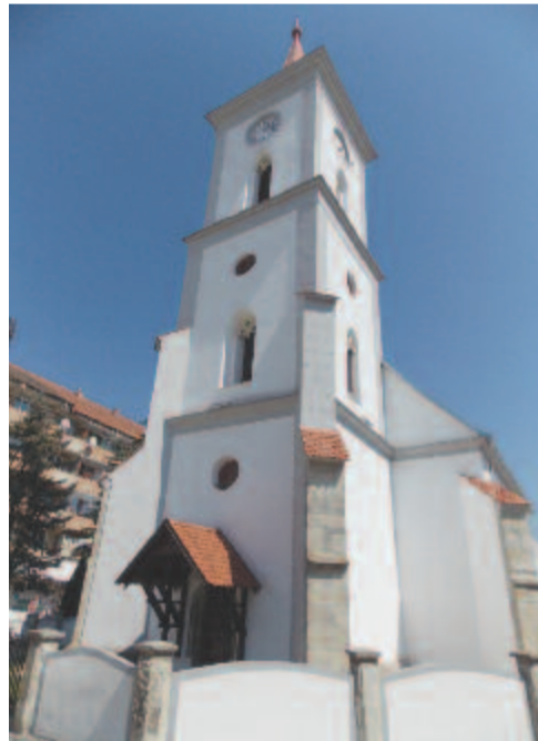
A bethleni református templom tornya