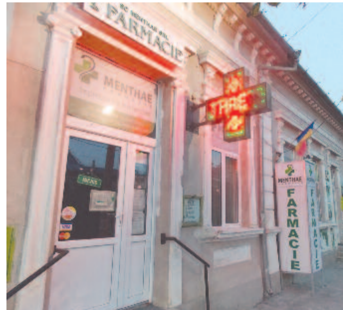
Az egykori Voith-patika

Az esti fényekben Lápos főterének két végéből néz szembe egymással a református és a katolikus templom, amelyeket középkori előzményeket követően az 1800-as évek derekán építettek. Míg az 1910-es adatok szerint a zsidó, román és örmény lakosok mellett Lápos népességének 79 százaléka magyar volt, egy évszázaddal később megfordult az arány, 2011-ben a kisváros 5367 lakosából